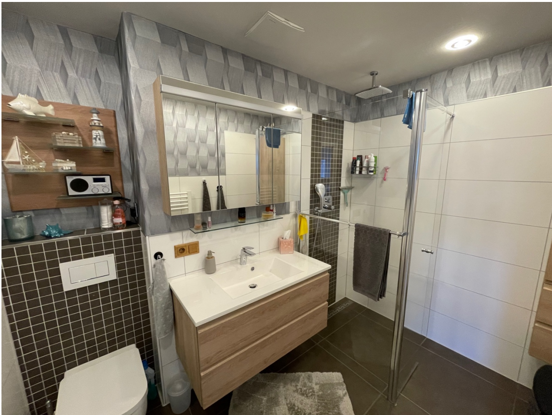
Badezimmer mit ebenerdiger Dusche