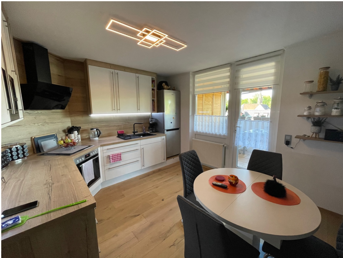
Küche mit Zugang zur Dachterrasse