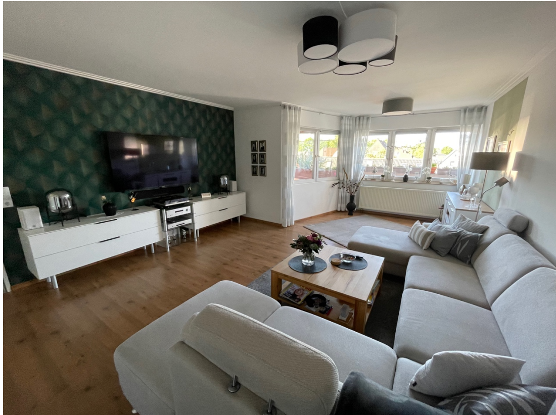
Wohnbereich mit Blick auf die Dachterasse