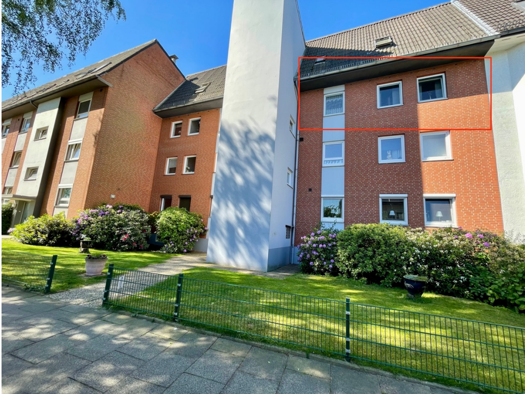
Ansicht von der Straße