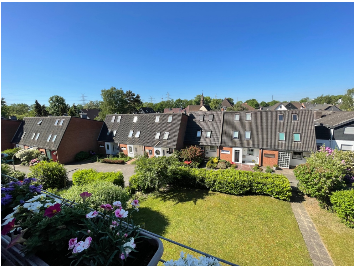
Ausblick von der Dachterrasse