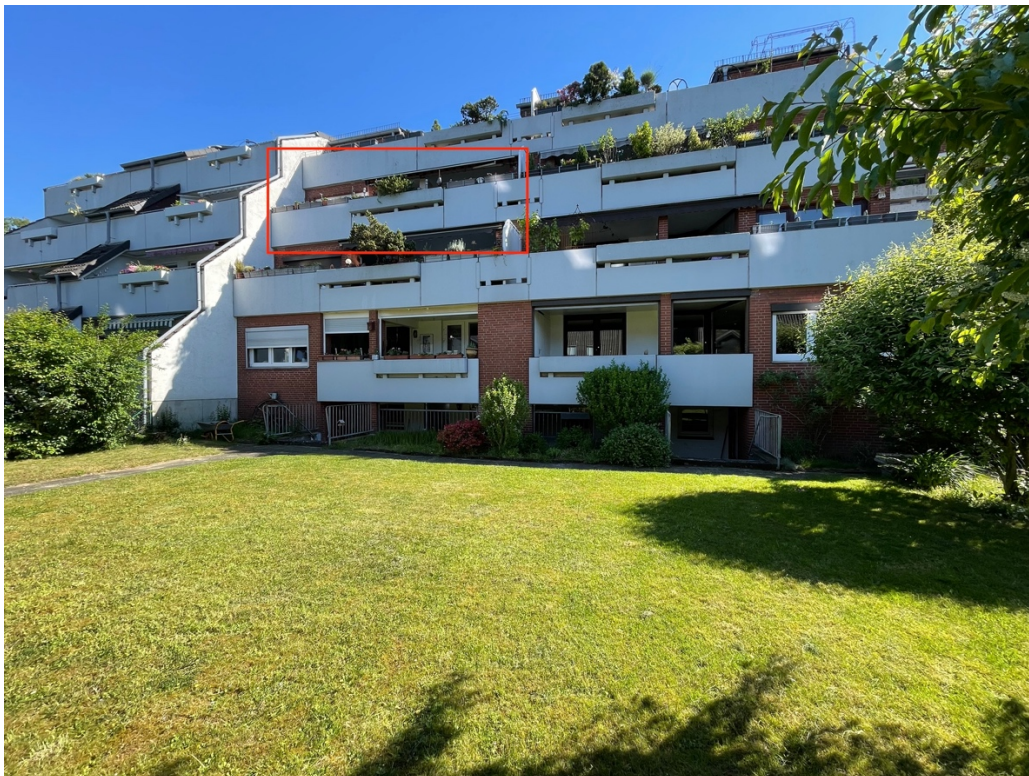
Blick vom Garten auf das Haus