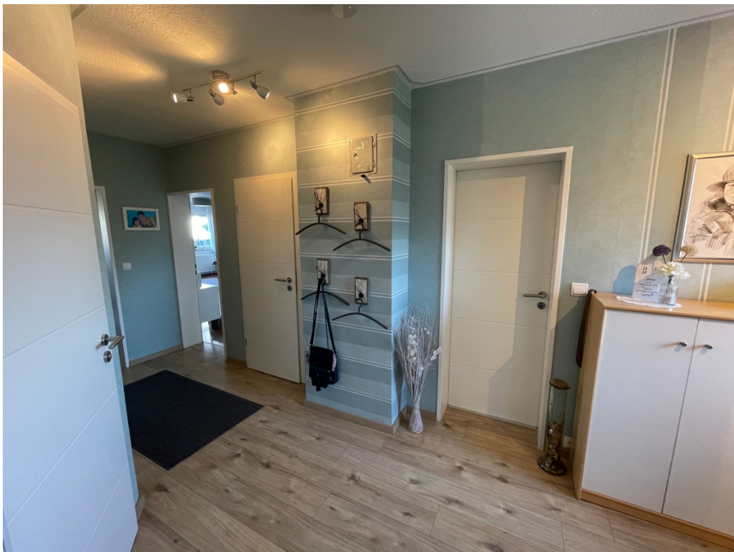
Blick in den Flur