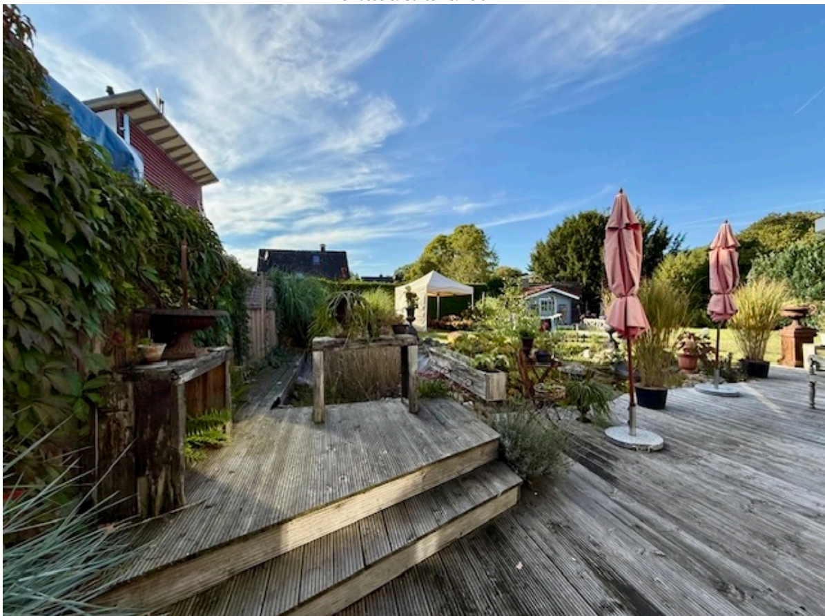
Terrasse & Garten & Teich