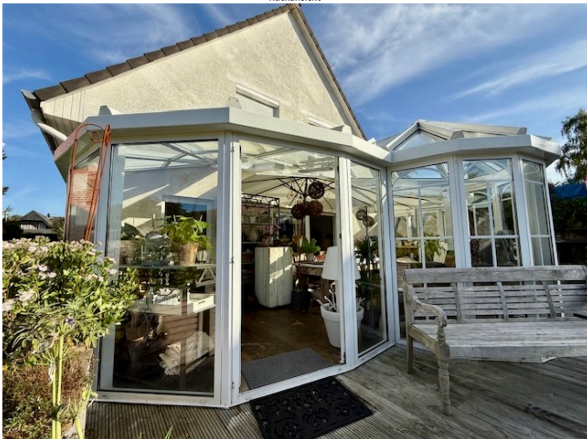
Wintergarten & Terrasse