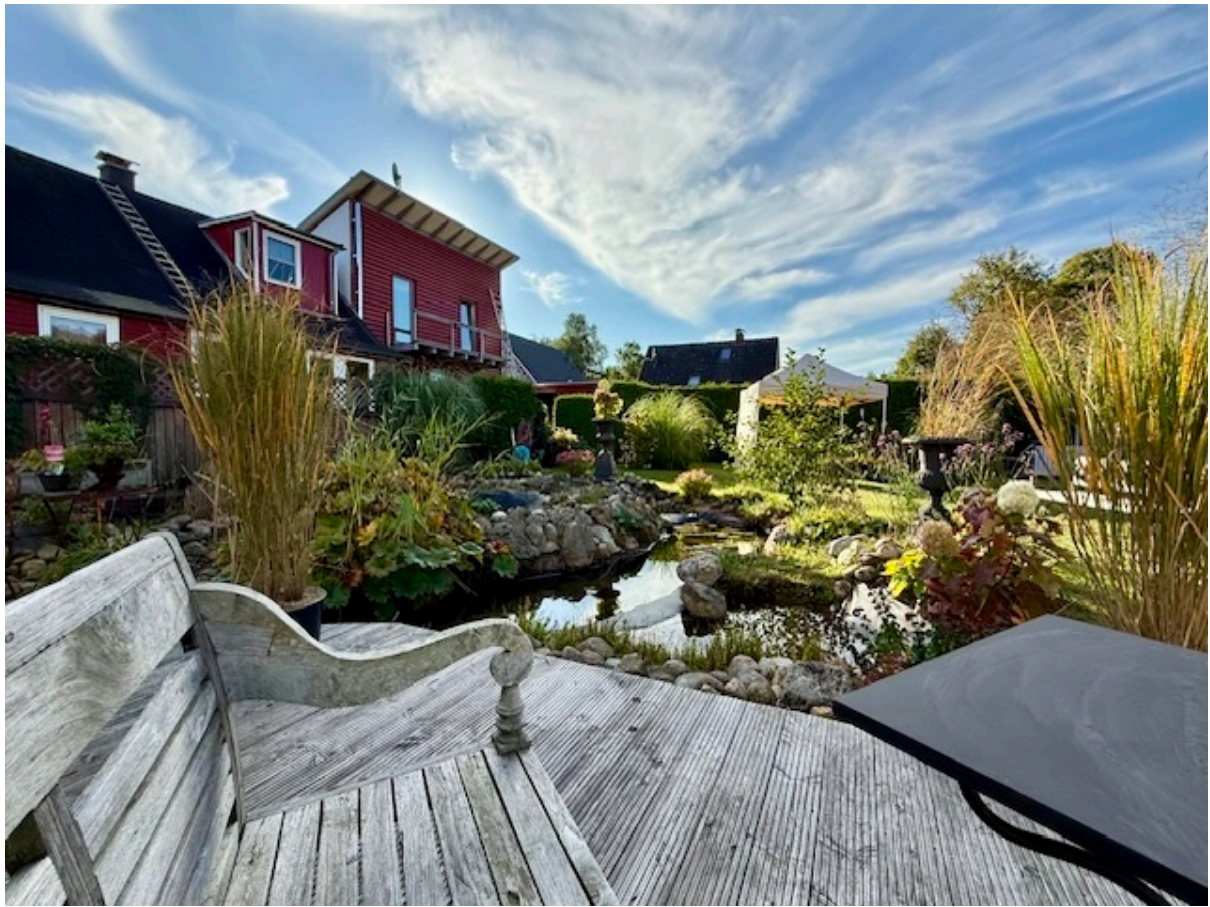
Terrasse & Garten & Teich