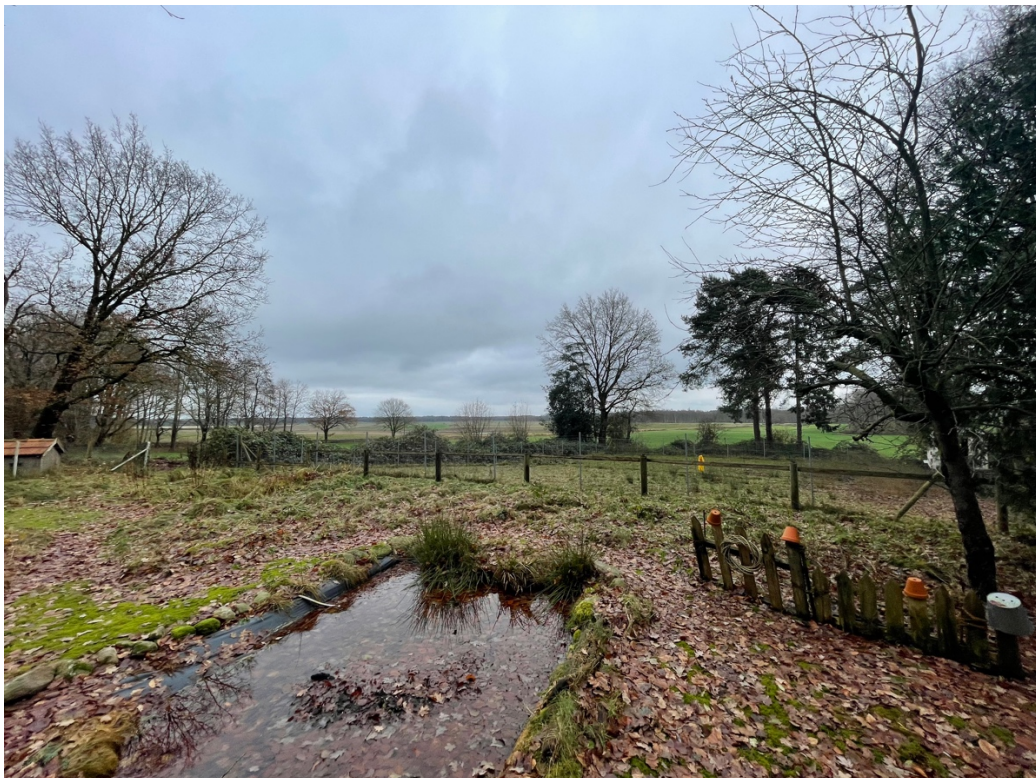
Freier Blick auf das Kuhstedter Moor