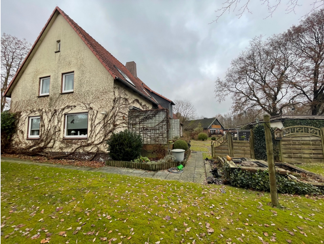
Garten und Terrasse