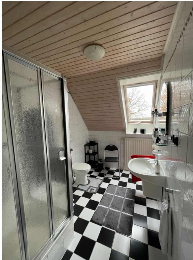
Badezimmer im OG