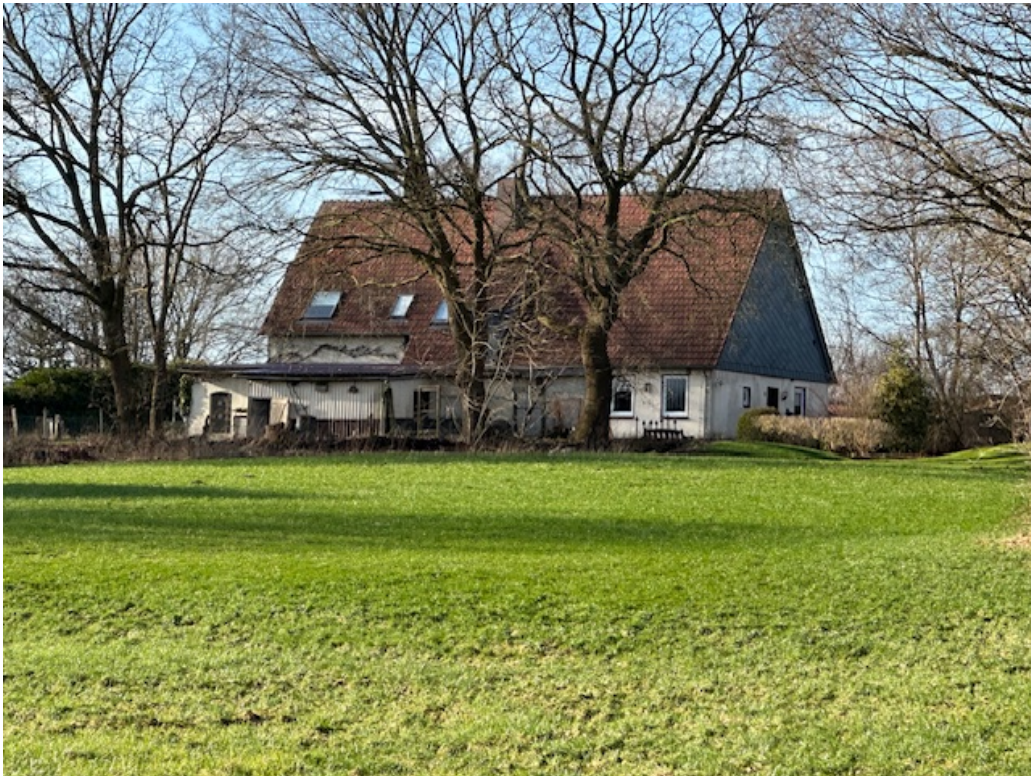
Blick von der Wiese hinter dem Haus