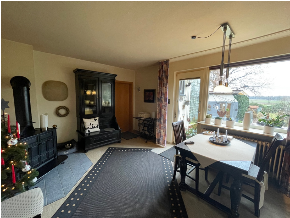
Essbereich mit Zugang zur Terrasse