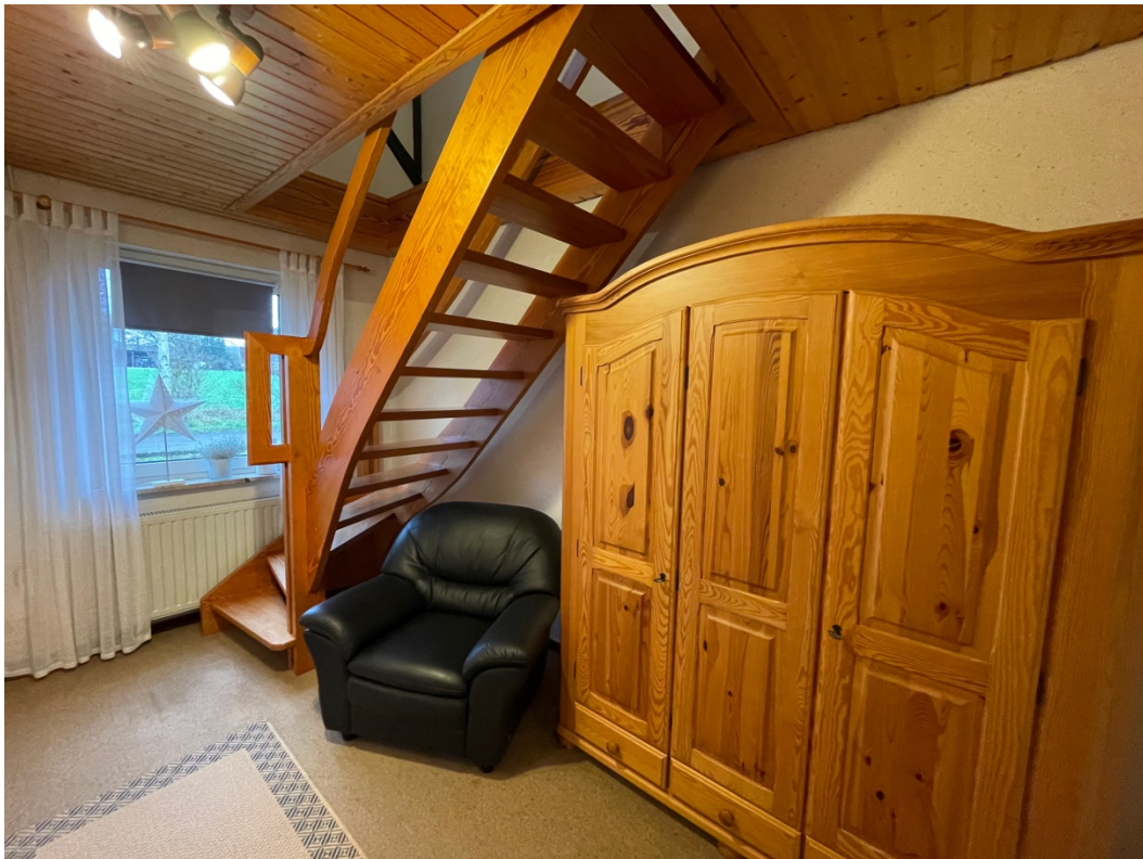
Flur mit Zugang in das Obergeschoss