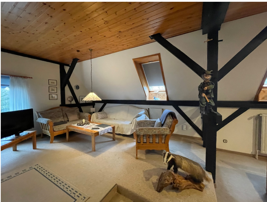
Offener Wohnbereich im Obergeschoss