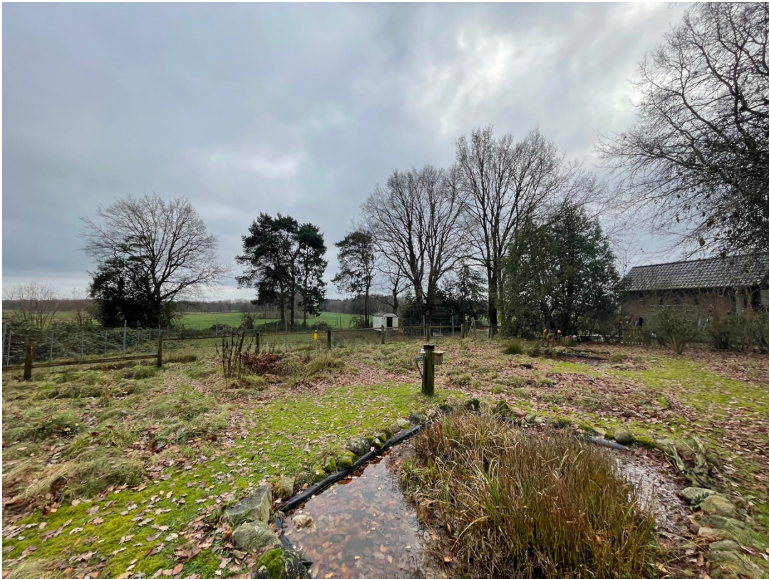
Gartenteich mit Tiefbrunnen