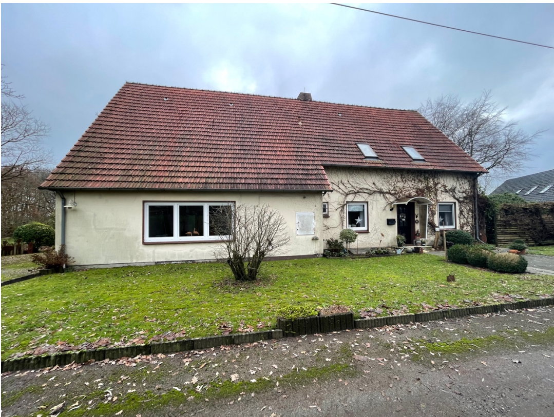
Blick von der Straße