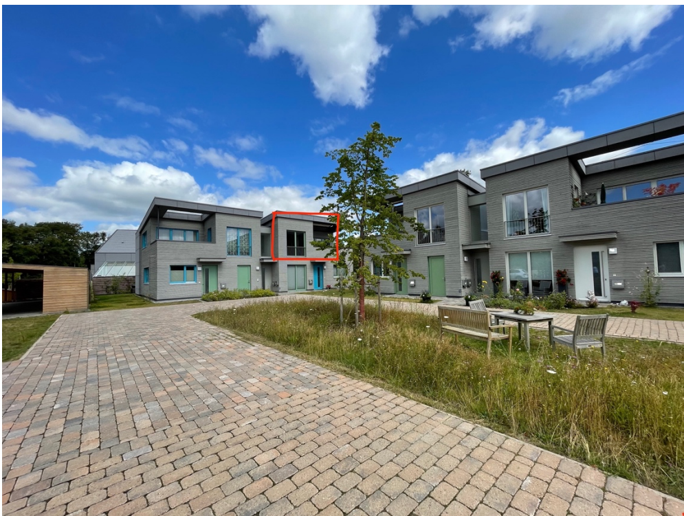
Blick auf die Nachbarschaft