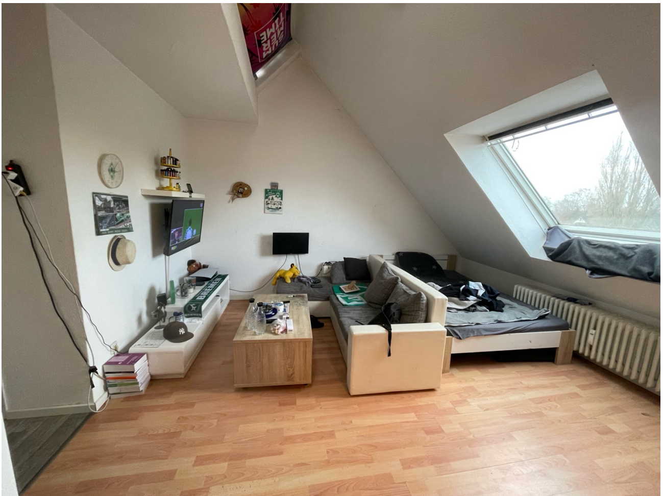
Wohn- und Schlafzimmer