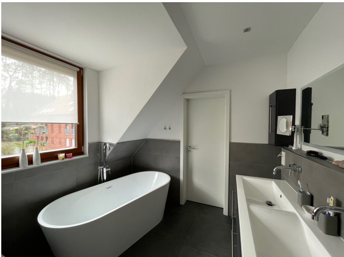
Badezimmer im OG