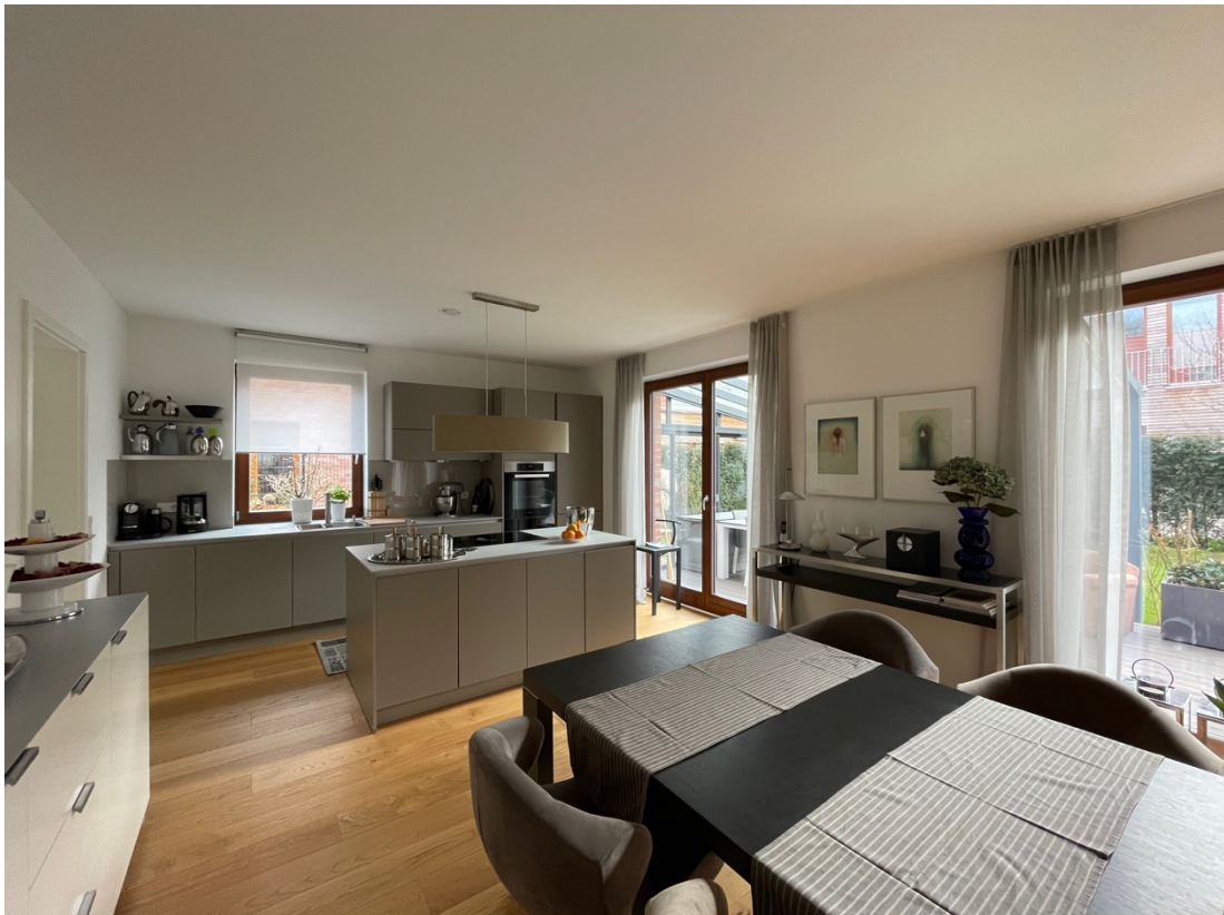
Essbereich mit Küche