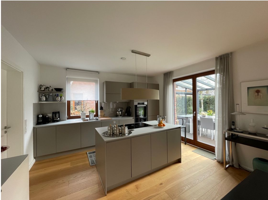
Offene Küche mit Tresen