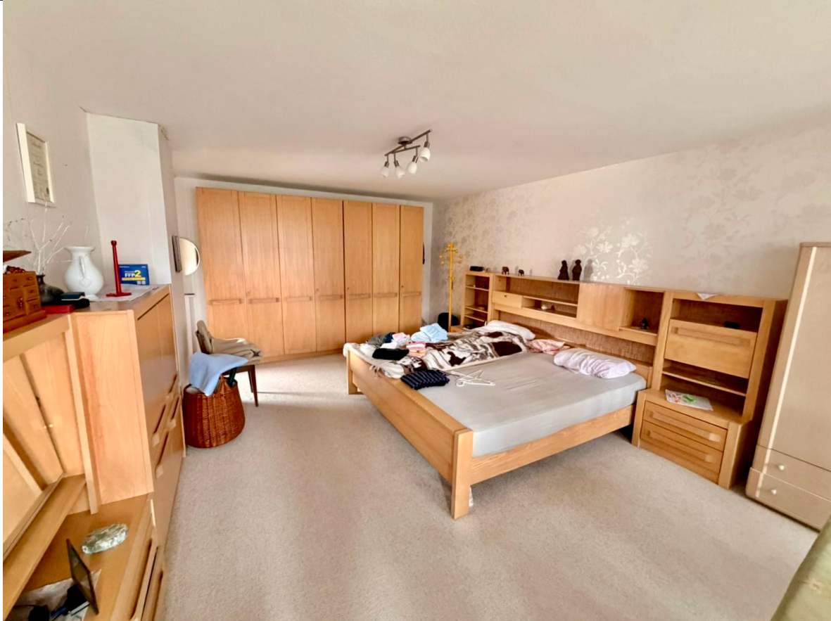
Schlafzimmer mit angrenzender Loggia