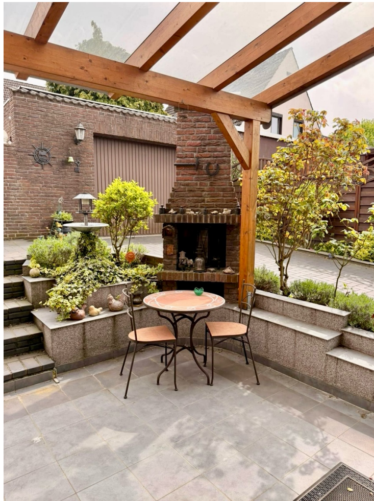
Außenkamin auf der Terrasse