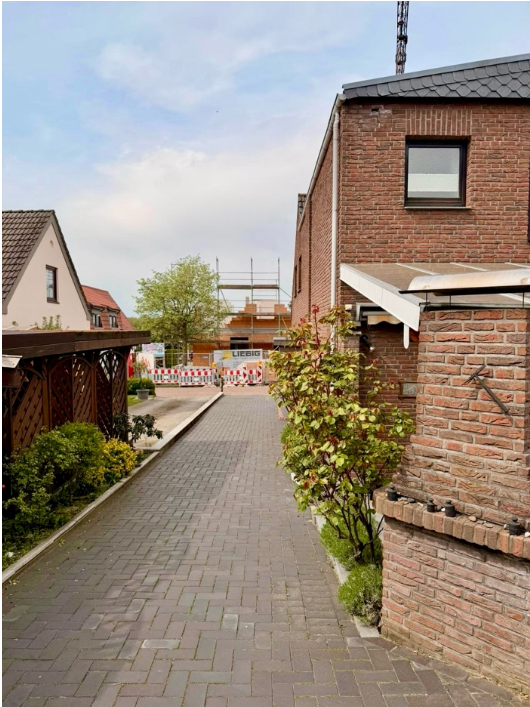
Außenansicht Zufahrt von der Straße zur Garage