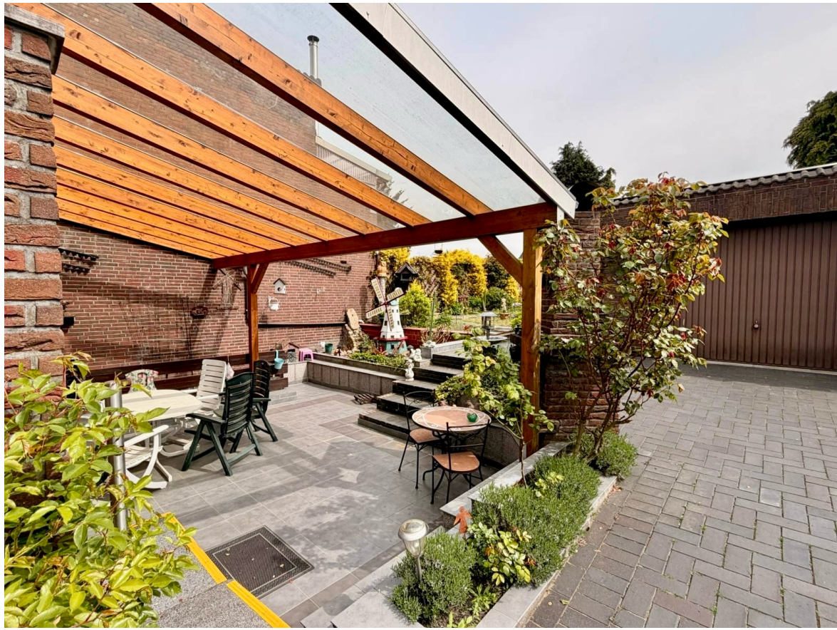
Überdachte Terrasse mit Blick in den Garten