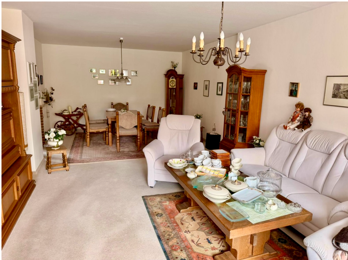
Wohn – und Essbereich