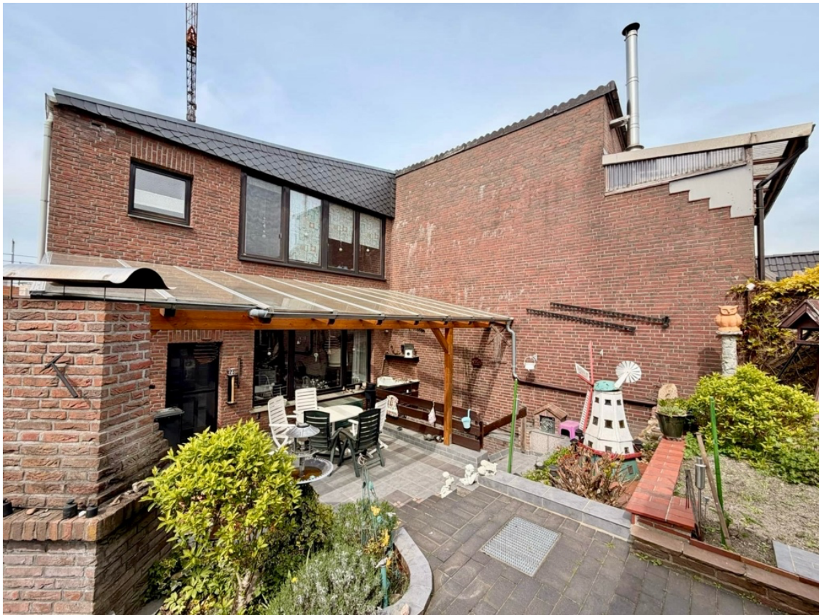
Blick vom Garten auf das Haus