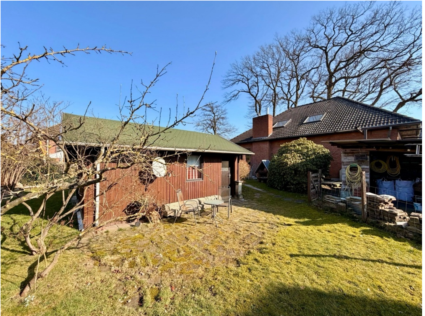
Blick vom Garten auf das Haus