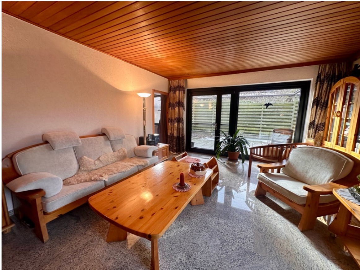
Wohnbereich mit Kamin und Sitzecke