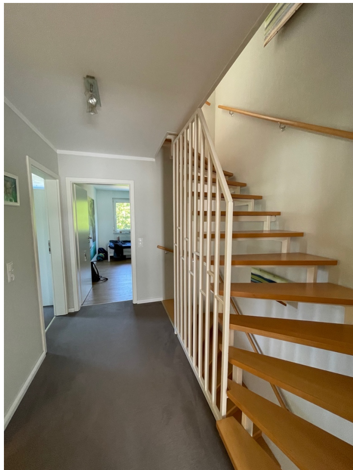
Flur im OG