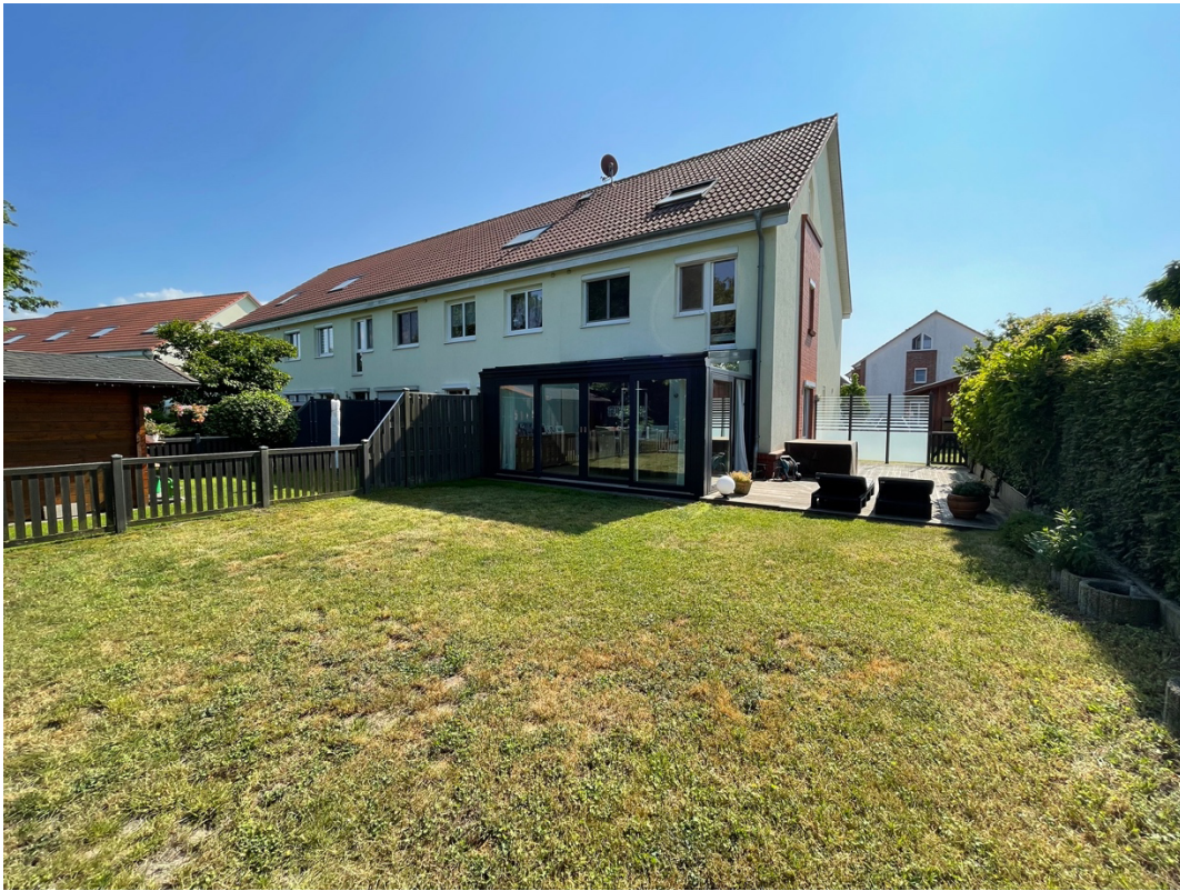
Blick auf den Wintergarten