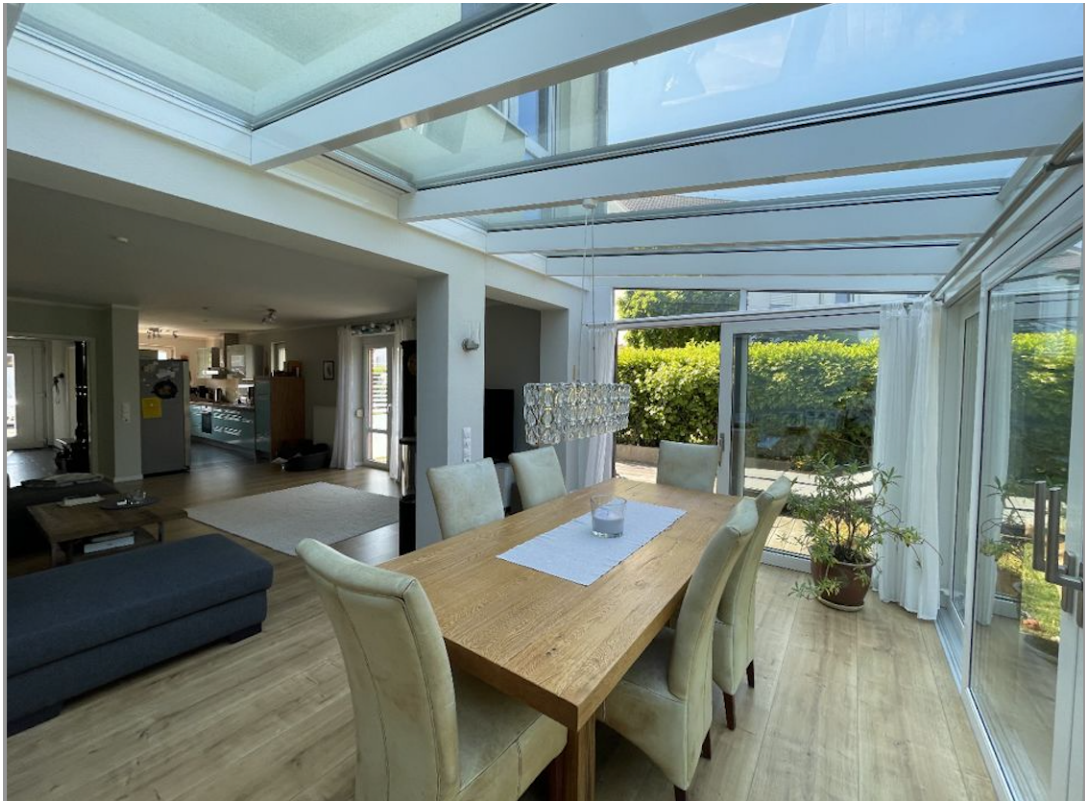
Zugang zur Terrasse