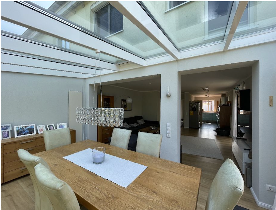
Wintergarten und Essbereich