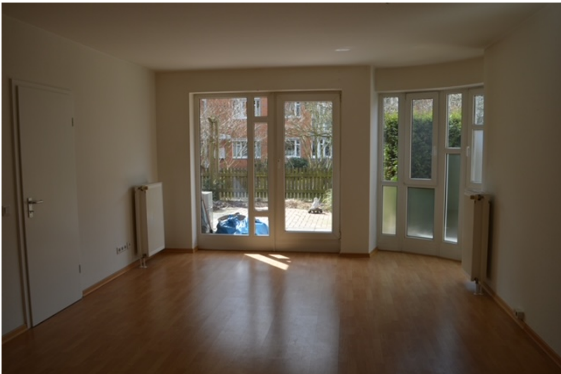
Wohnbereich mit Blick auf die Terrasse