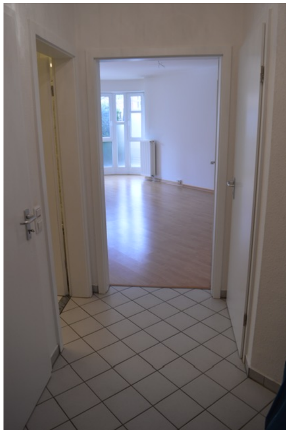
Flur / Eingangsbereich