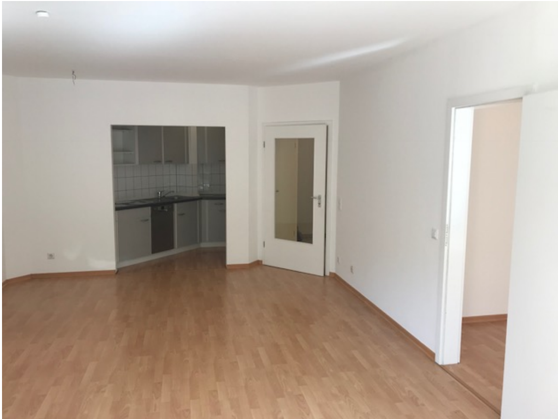
Wohnbereich mit Blick auf die Küche