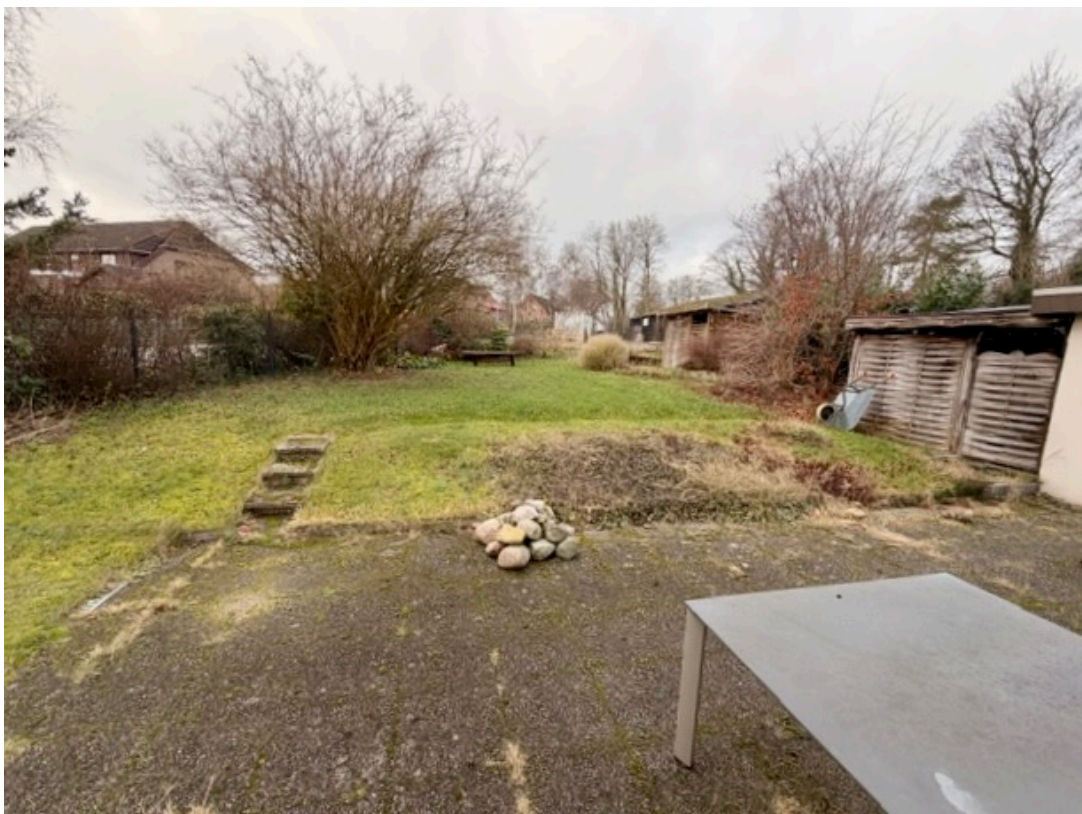
Blick in den Garten & Geräteschuppen