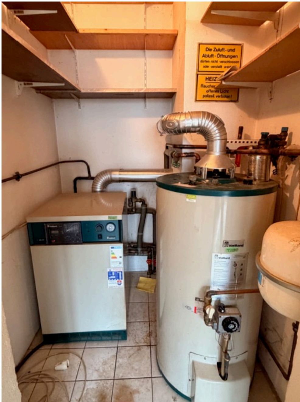
Heizungsraum im Erdgeschoss