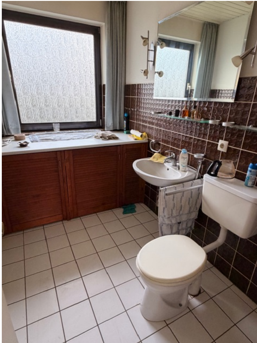
Bad im Erdgeschoss