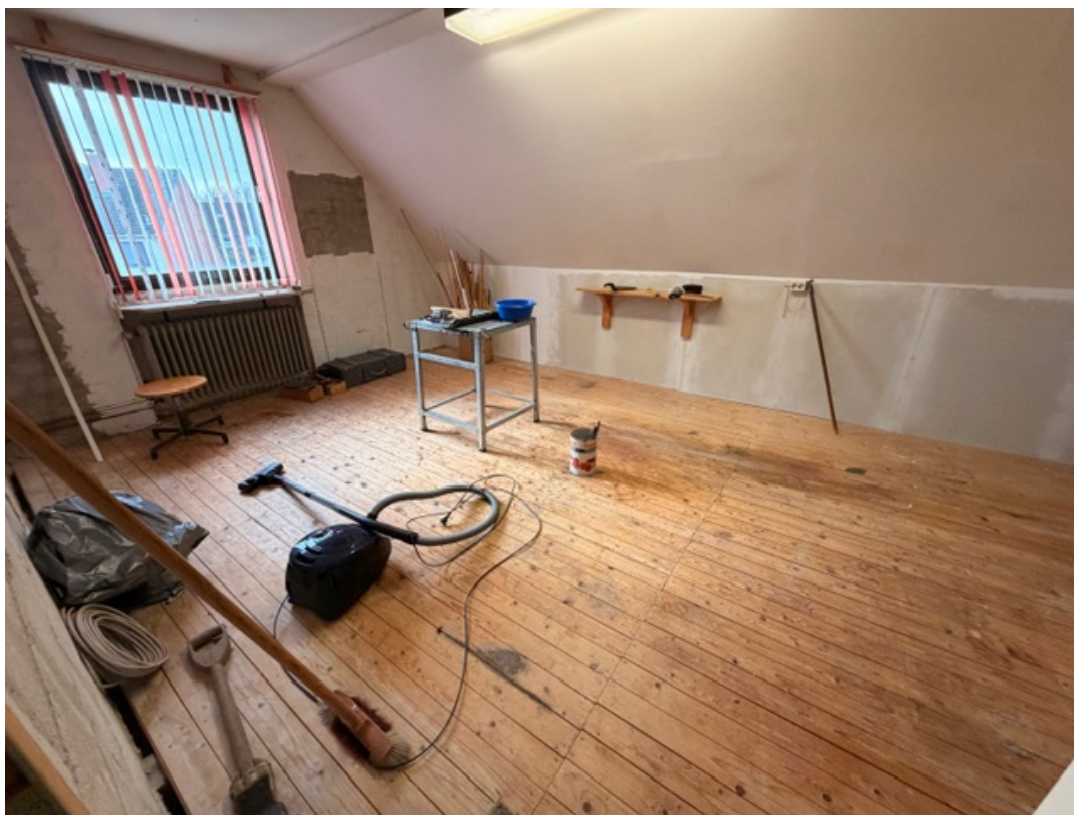
Zusätzliches Zimmer mit Ausbaupotenzial