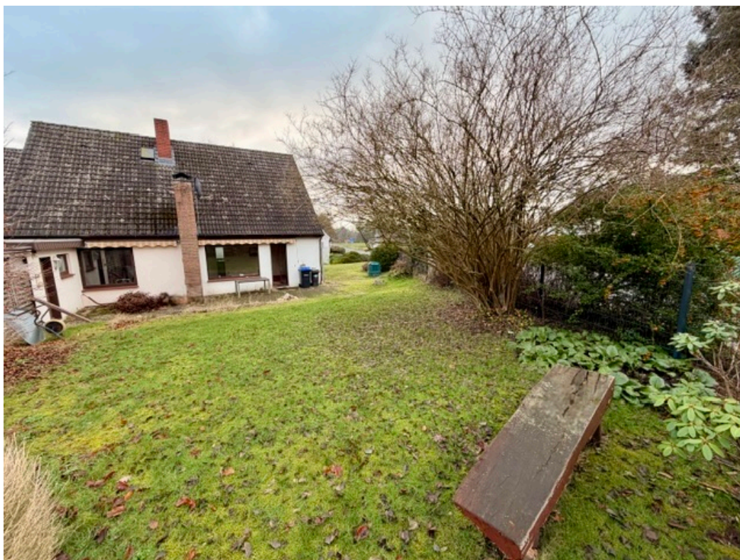
Rückansicht Garten & Terrasse