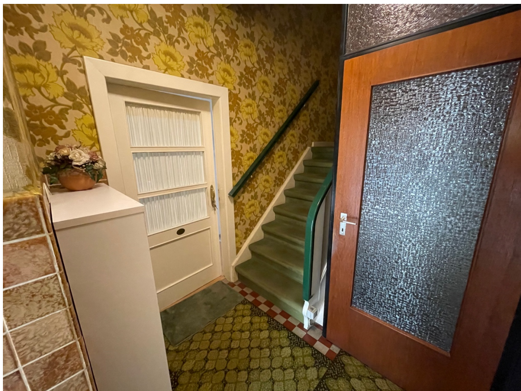
Hausflur und Kellerabgang