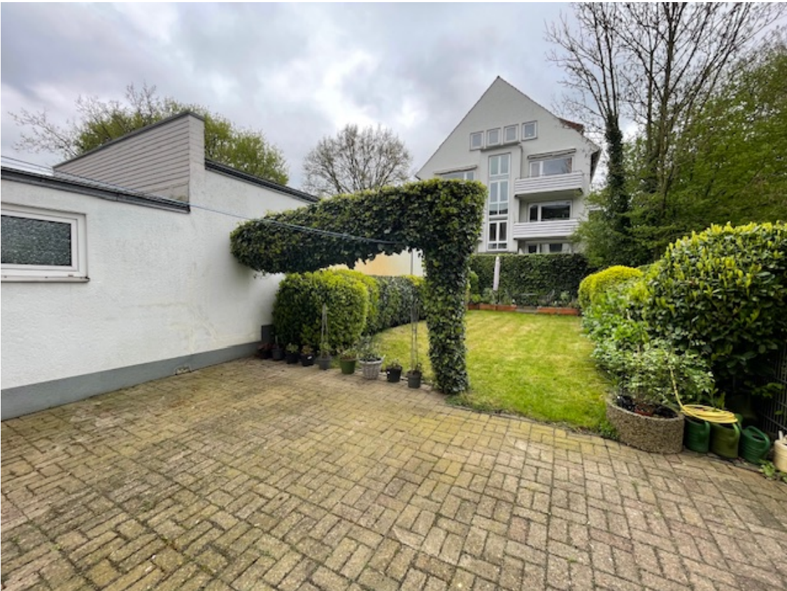
Innenhof mit Garten