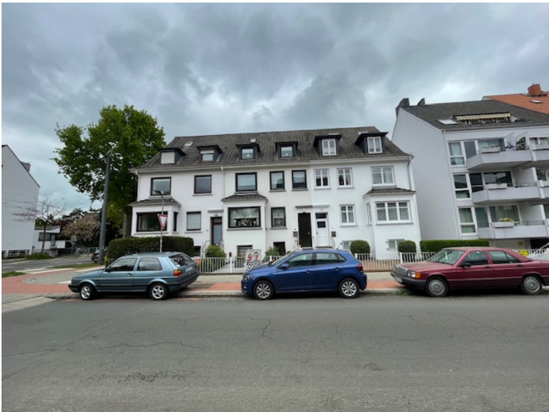
Blick von der gegenüberliegenden Straßenseite