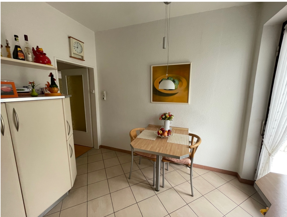
Essbereich in der Küche