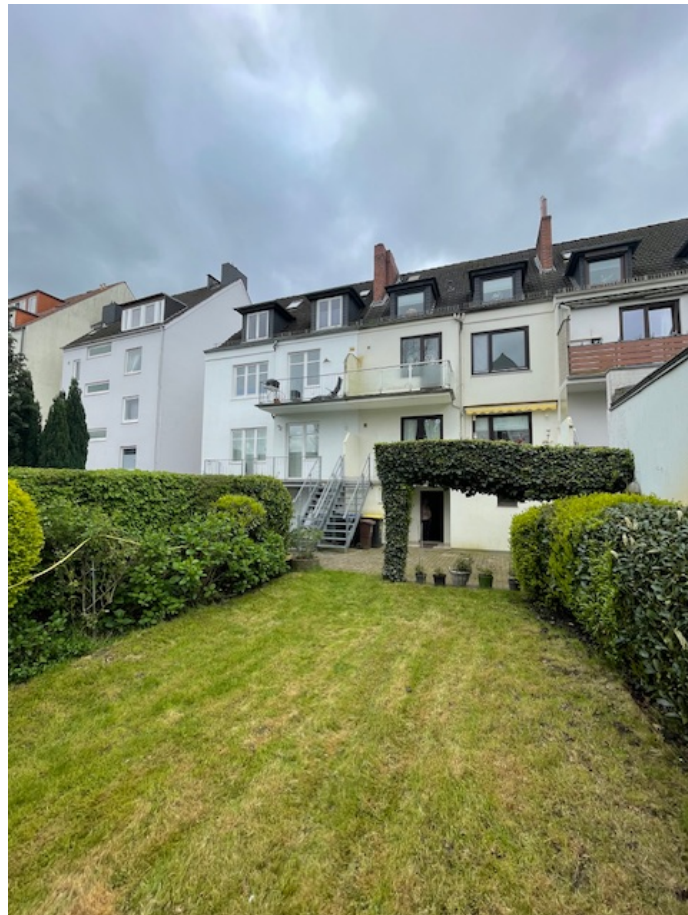
Rückansicht des Hauses