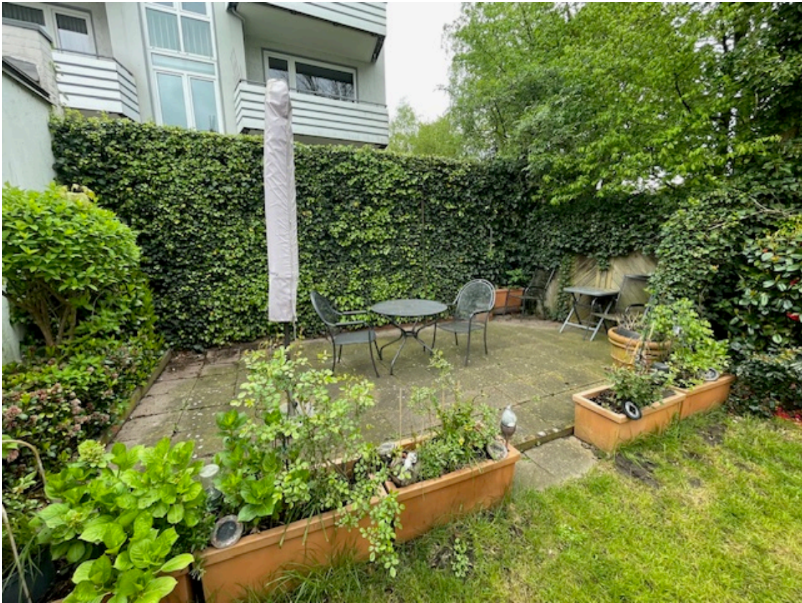
Terrasse im Garten