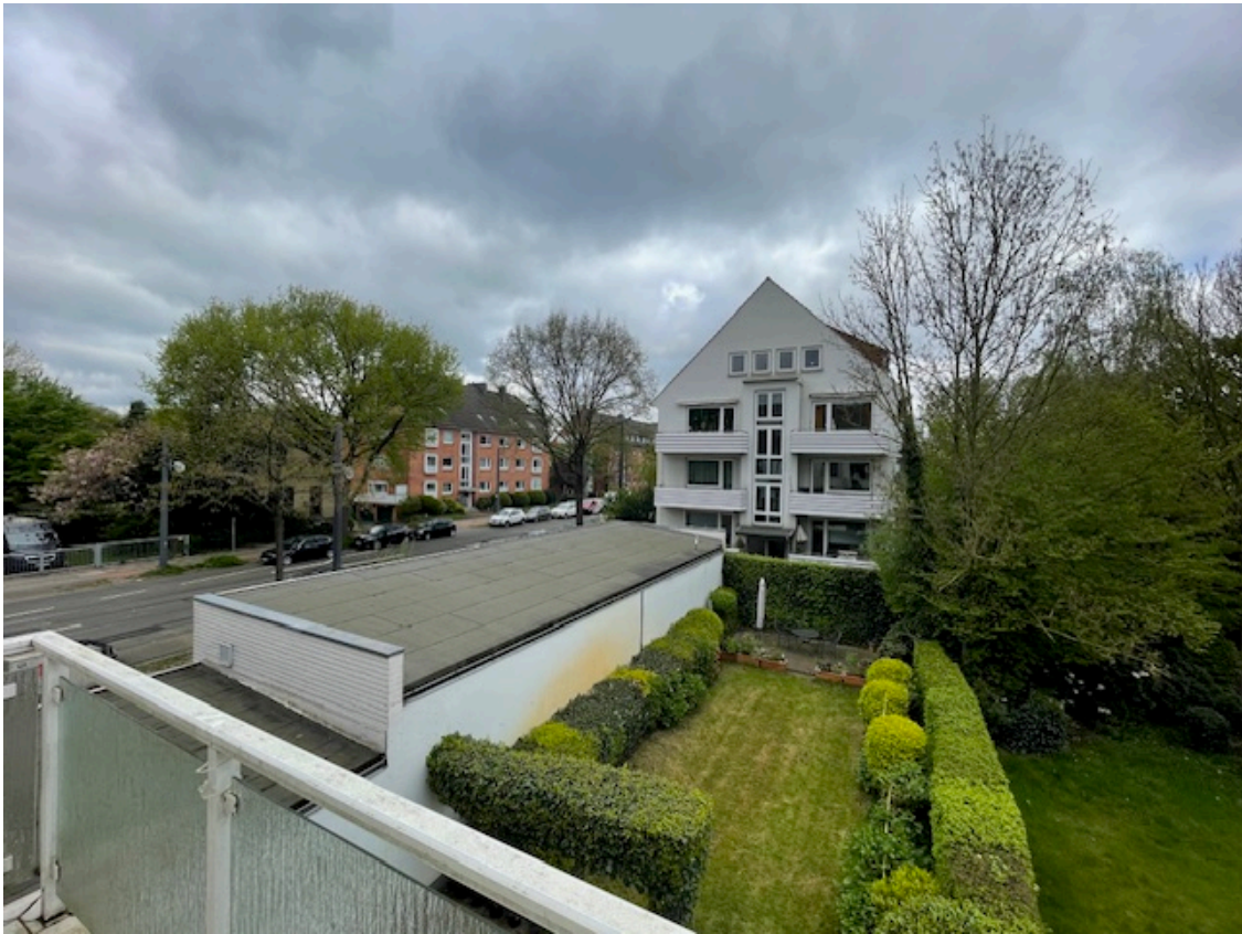
Aussicht vom Balkon des 1.OG