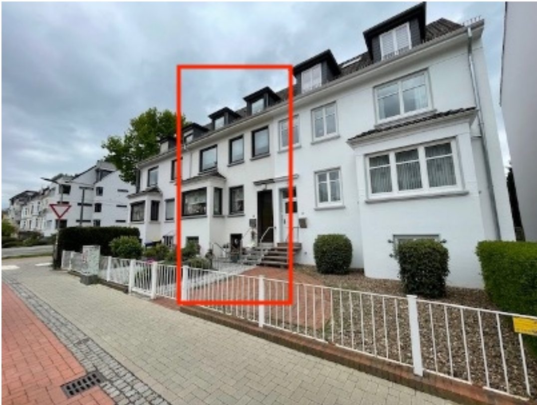
Ansicht vom Bürgersteig